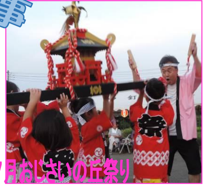
7月おじさいの庄祭り