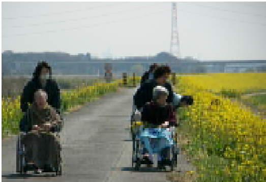
桶川の土手へ行きました

別の所でお花が咲いている所はないかと、何人かの利用者さんと共に荒川の土手まで散策に行きました。辺り一面に広がる菜の花畑に一同ビックリ！「こんな光景見たことないわ」「まるで絨毯みたい！」と好評だった模様。