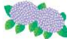
養護老人ホーム 富士見園