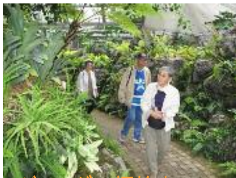
ジャングル探検中?